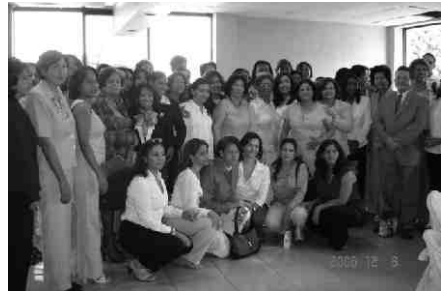
Día del Farmacéutico, SESPAS, 8/12/2006