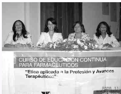
Curso de educación continua para farmacéuticos realizado conjuntamente con Lab. Menarini 11/11/06