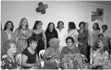
Directiva de la Asociación Farmacéutica Dominicana, Inc.