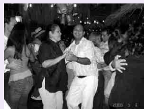
Asistentes a la Fiesta típica