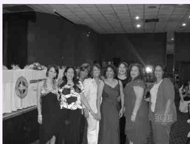
Directiva entrante y saliente comparte con farmacéuticos asistentes al acto de juramentación 2007-2008.