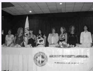
Foto conjunta de directiva entrante y saliente