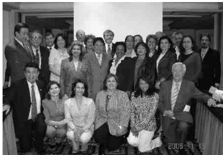
Miembros de FePaFar durante la asamblea realizada el 13 de noviembre de 2006